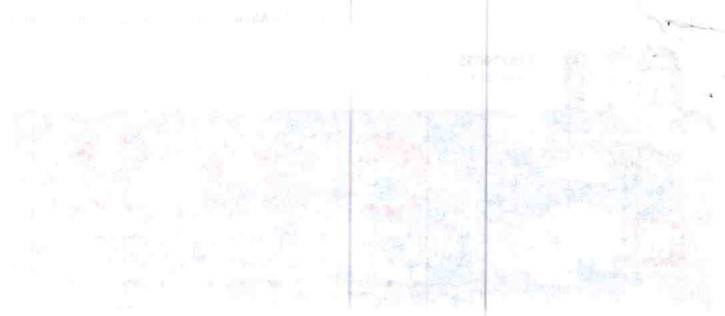
Figure 1. Distribution of [illegible] in the United States. The map shows the geographic spread of the data points, with a higher concentration in the eastern and central regions.